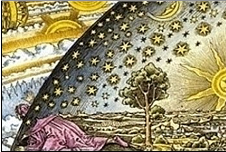
Abb. 2 „Blick in die Übernatur“. Nach mittelalterlichen Vorstellungen galt die Natur der Himmelskörper als unerforschbar und in die göttliche Sphäre eingebettet. Ihre Gesetze sollten sich grundlegend von jenen der irdischen Physik unterscheiden. So blieb das Wesen der Gravitation lange unergründet. Erst mithilfe der naturalistischen Physik gelang es, jene Kräfte zu erforschen, nach denen sich Planeten bewegen und Gegenstände zur Erde fallen.

Dass supranaturalistischen Deutungen im Vergleich zu naturwissenschaftlichen Theorien Erklärungsdefizite haben, lässt sich auch anhand der Evolutionstheorie zeigen: Warum etwa, so ist zu fragen, zeigt der Fossilienbefund alle wünschenswerten Übergänge zwischen dem wolfsähnlichen Raubtier Mesonychids und den heutigen Vertretern der Wale (Abb. 3), wenn es dem Schöpfer gefiel, die Lebewesen als diskrete Grundtypen zu erschaffen, wie die Kreationisten behaupten? Der Evolutionstheorie zufolge sind solche Fossilien-Reihen evident : Die abgestufte Ähnlichkeit der Fossilien, deren Gestalt sich immer mehr den heutigen Verhältnissen annähert, je jünger sie sind, ist logisch zwingend , wenn sich die Arten durch die Mechanismen der Vererbung, Variation und Selektion allmählich auseinander entwickelt haben.